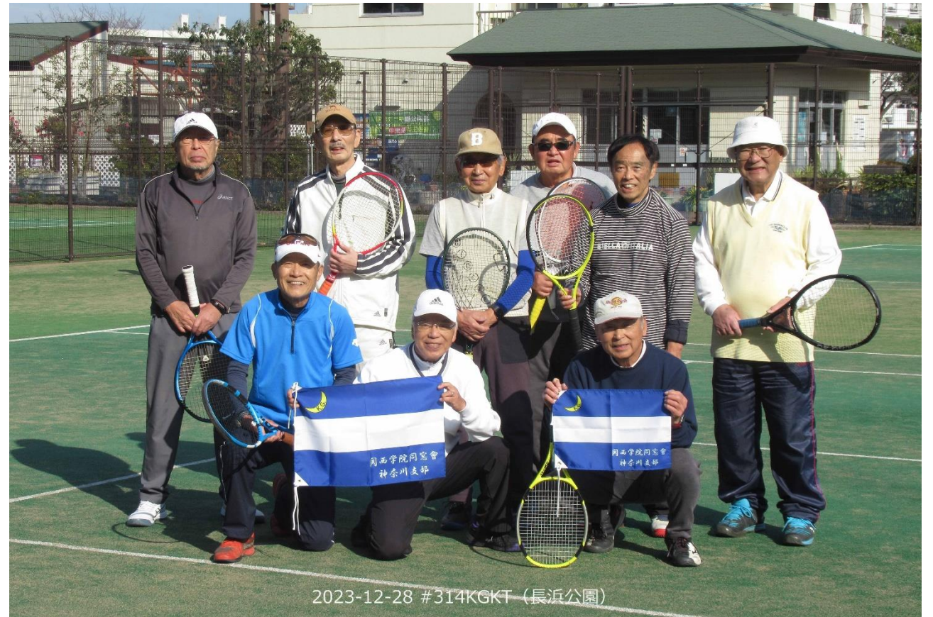
2023-12-28 #314KGKT (長浜公園)