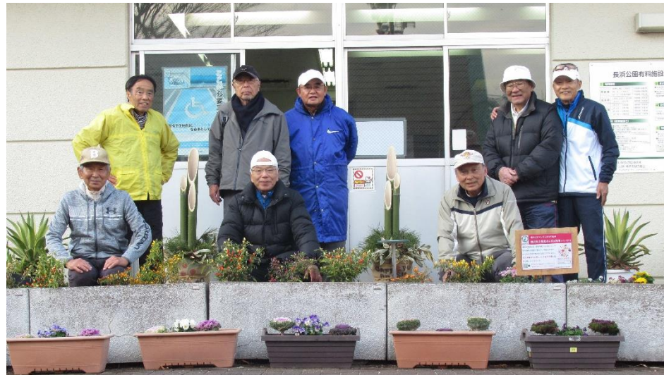
<管理事務所前の門松飾りを背に>

今年1年の打ち納めに相応しく好天に恵まれました。とくに前半はコート一面に陽が差し込み、10℃そこそこの気温より体感はずっと暖かったです。9名2面のため交代休憩は殆どなく、全員、今年最後のテニスを十二分に堪能しました。反省会はなし。