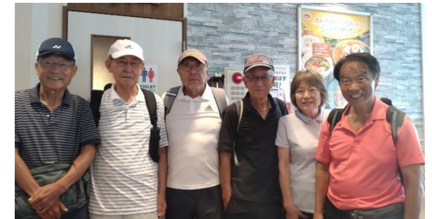
反省会6名 (3名はテニスと合わせて延べ6時間)