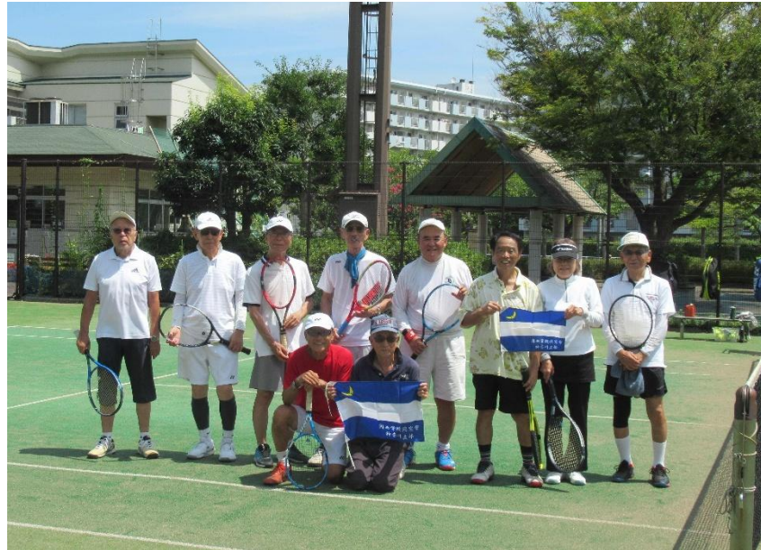
後半10名(4時間プレーは8名)