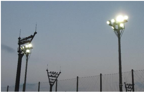
18時より点灯(最後の1時間)