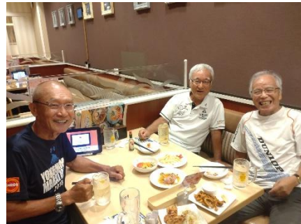
ジョナサン並木店